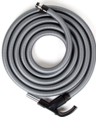
Switched hose 7,5m Soft Grip I.0208.1075

Dieses Set ist mit einem Standardschlauch oder einem Schaltschlauch (mit Schalter ON/OFF am Griff) erhältlich