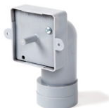
Millennium curved fitting I.0451.1000