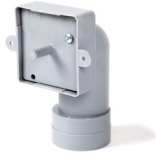
Supernova curved fitting I.0451.1000