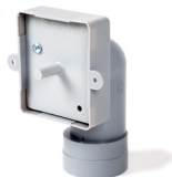
Design curved fitting I.0411.1000