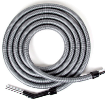
Standard hose 7,5m I.0200.1075